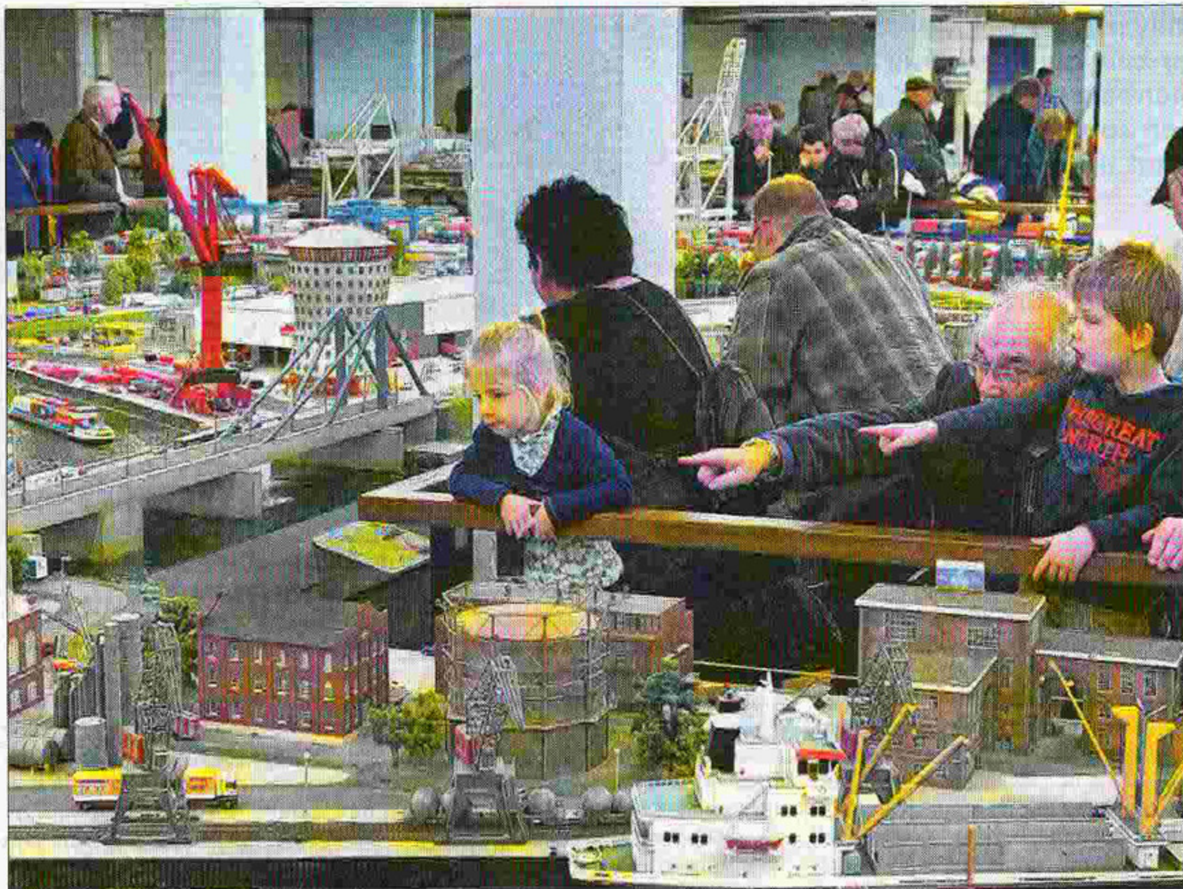
Voor opa én kleinzoon is Miniworld Rotterdam een groot feest van herkenning.

Hij is maar wat trots dat 'zijn' attractie in deze tijd van minder en minder zo lekker loopt. Bij de start in 2007 trok de attractie in een jaar tijd 31.000 bezoekers. Eind vorig jaar stond de 'jaarteller' op 83.000, weer 3000 mensen meer dan in 2011. En dat is vooral te danken aan het enthousiaste team, vertelt Van Buren. „We hebben het niet makkelijk gehad. Anderhalf jaar lag hier alles voor de deur open, mensen konden ons amper vinden. Dan is het: verstand op nul en doorgaan. En dat in deze crisistijd en zonder